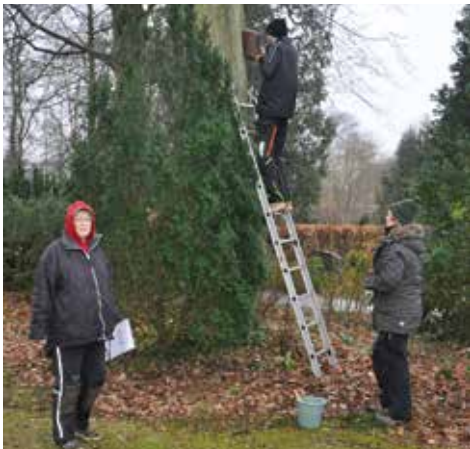
Mitglieder des Fördervereins beim Säubern der Nistkästen