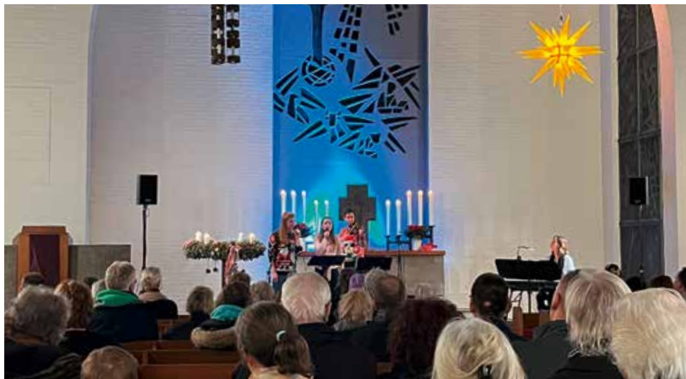
Adventskonzert 2024 in der Tornescher Kirche