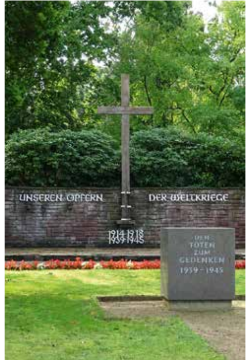
Beide Bilder: Friedhof Tornesch