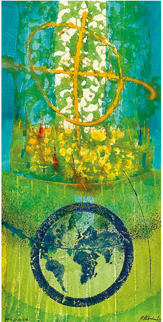
© Bild „ Gebet für die Erde “ - zur Jahreslosung 2023: Jörgen Habedank 2019