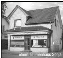
ehem. Blumenhaus Sonja