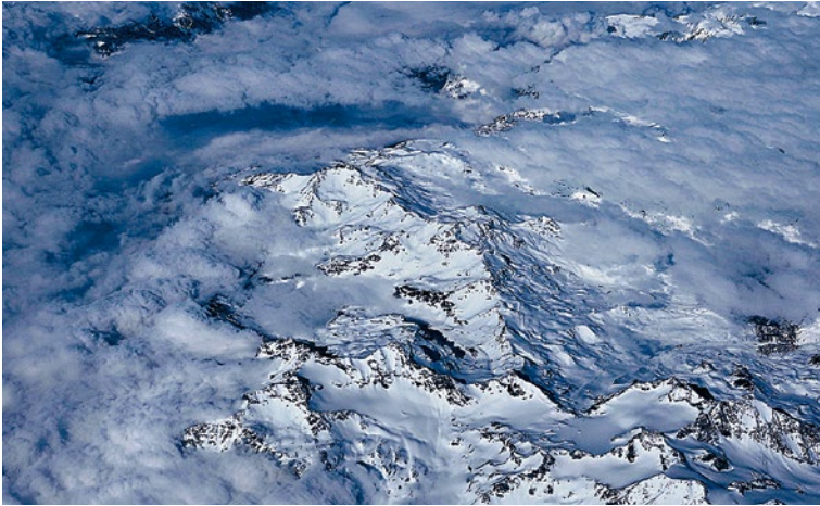
Blick auf die schneebedeckten Gipfel der Alpen beim Überflug

Dann im März verdichteten sich ja die Nachrichten mit den Infektionszahlen und den sehr