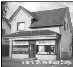
ehem. Blumenhaus Sonja